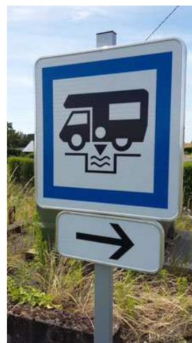
Mise en service de l'aire de camping-car

L'organisation d'une manifestation sur le thème des arbres et la mise en valeur de ce patrimoine, en partenariat avec des professionnels et des associations de la commune, est en cours de réflexion.