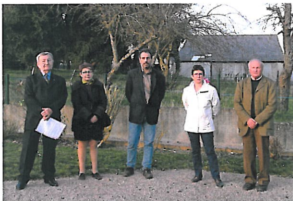
19 Mars : accords d'Evian pour l'Algérie avec la FNACA