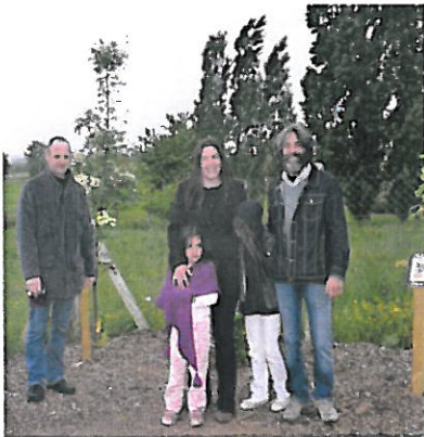
Parrainage des arbres 1 enfant /1 sorbier

Ouverture du secrétariat : Lundi et Vendredi de 14 H à 16 H 30 Jeudi de 9 H à 12 H et de 14 H à 16 H 30