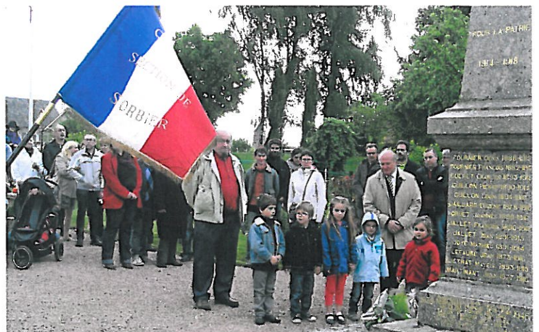
8 Mai : 70ème anniversaire de l'armistice de la seconde guerre nationale