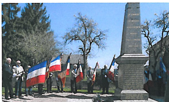
12 Avril : rassemblement cantonal des CATM à Sorbier